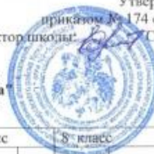
График проведения промежуточной аттестации учащихся МКОУ "Березовешская основная общеобразовательная школа" Пошаровского района Курской области на 2020-2021 уч.г.